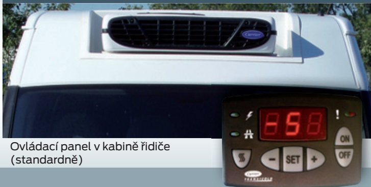
Ovládací panel v kabině řidiče (standardně)

Jednotku lze na přání zapustit do zvýšené střechy